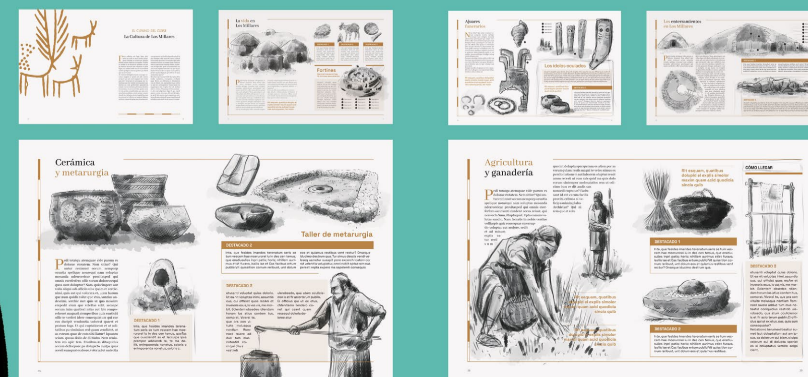
Bocetos de dobles páginas temáticas del cuadernillo interior pertenecientes a la parte de guía.